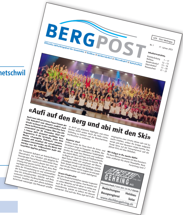
Verteilung in alle Haushaltungen inkl. Stopp-Kleber